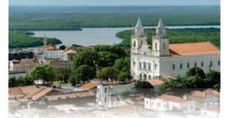
Rio Sanhuaú / Centro Histórico

João Pessoa, 12 de fevereiro de 2025 * nº 0715 * Pág. 001/024