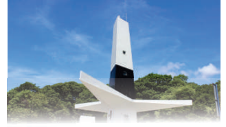
FAROL DO CABO BRANCO

João Pessoa, 29 de janeiro de 2025 * nº 0705 * Pág. 001/018