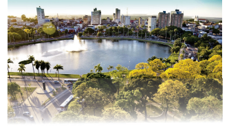
PARQUE SOLON DE LUCENA

João Pessoa, 22 de novembro de 2024 * n° 0660 (SUPLEMENTO) * Pág. 001/010