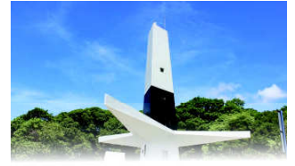
FAROL DO CABO BRANCO

João Pessoa, 30 de agosto de 2024 * nº 0603 * Pág. 001/018