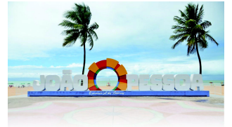
PRAIA DE TAMBAÚ

João Pessoa, 19 de junho de 2024 * n° 0553 (SUPLEMENTO) * Pág. 001/002