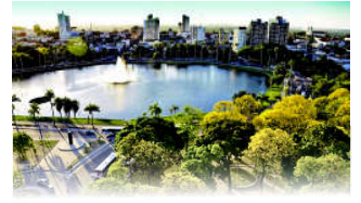
PARQUE SOLON DE LUCENA

João Pessoa, 03 de abril de 2024 * nº 0501 * Pág. 001/018