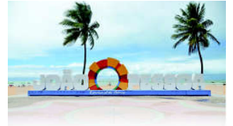
PRAIA DE TAMBAÚ

João Pessoa, 15 de março de 2024 * nº 0489 (SUPLEMENTO) * Pág. 001/002