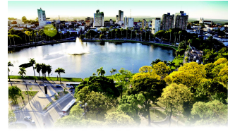
PARQUE SOLON DE LUCENA

João Pessoa, 09 de fevereiro de 2024 * nº 0466 (SUPLEMENTO) * Pág. 001/008