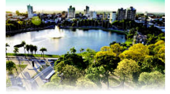
PARQUE SOLON DE LUCENA

João Pessoa, 07 de fevereiro de 2024 * nº 0464 * Pág. 001/030