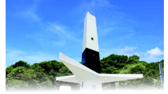
FAROL DO CABO BRANCO

João Pessoa, 02 de fevereiro de 2024 * nº 0461 * Pág. 001/032