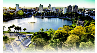
PARQUE SOLON DE LUCENA

João Pessoa, 01 de fevereiro de 2024 * n° 0460 (SUPLEMENTO) * Pág. 001/004