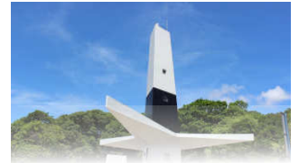
FAROL DO CABO BRANCO

João Pessoa, 13 de dezembro de 2023 * n° 0425 * Pág. 001/026