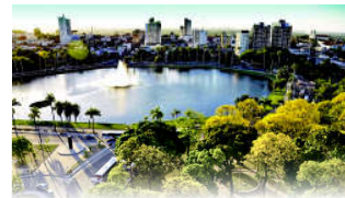
PARQUE SOLON DE LUCENA

João Pessoa, 29 de novembro de 2023 * n° 0415 * Pág. 001/036