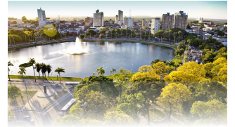
PARQUE SOLON DE LUCENA

João Pessoa, 22 de novembro de 2023 * nº 0410 (SUPLEMENTO) * Pág. 001/008