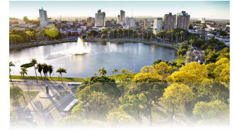
PARQUE SOLON DE LUCENA

João Pessoa, 09 de outubro de 2023 * nº 0381 * Pág. 001/014