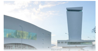
TEATRO PEDRA DO REINO

João Pessoa, 18 de julho de 2023 * n° 0324 (SUPLEMENTO) * Pág. 001/004