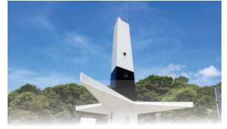
FAROL DO CABO BRANCO

João Pessoa, 07 de junho de 2023 * nº 0296 * Pág. 001/020