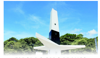
FAROL DO CABO BRANCO

João Pessoa, 07 de dezembro de 2022 * n° 174 * Pág. 001/060