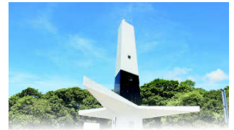
FAROL DO CABO BRANCO

João Pessoa, 07 de novembro de 2022 * nº 153 * Pág. 001/021