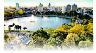
PARQUE SOLON DE LUCENA

João Pessoa, 26 de outubro de 2022 * nº 0148 * Pág. 001/018