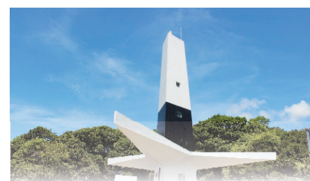
FAROL DO CABO BRANCO

João Pessoa, 13 de setembro de 2022 * nº 117 SUPLEMENTAR * Pág. 001/011