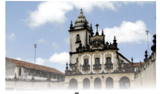
IGREJA DE SÃO FRANCISCO

João Pessoa, 19 de agosto de 2022 * nº 0101 * Pág. 001/028