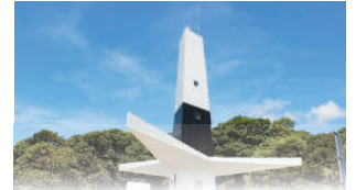
FAROL DO CABO BRANCO

João Pessoa, 25 de abril de 2022 * nº 0019 * Pág. 001/012