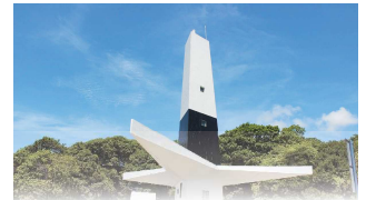
FAROL DO CABO BRANCO

João Pessoa, 26 de abril de 2022 * n° 0020 * Pág. 001/030